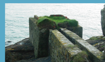
BAÑONS DE SOUTULLO