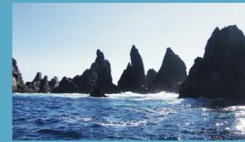
ILLOTES DOS AGUILLONS