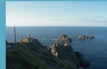
FARO DO CABO ORTEGAL