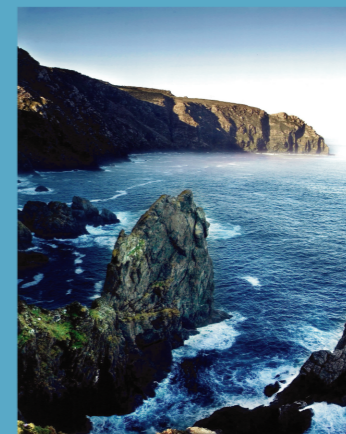
VISTA COVA DAS FIGUEIRAS