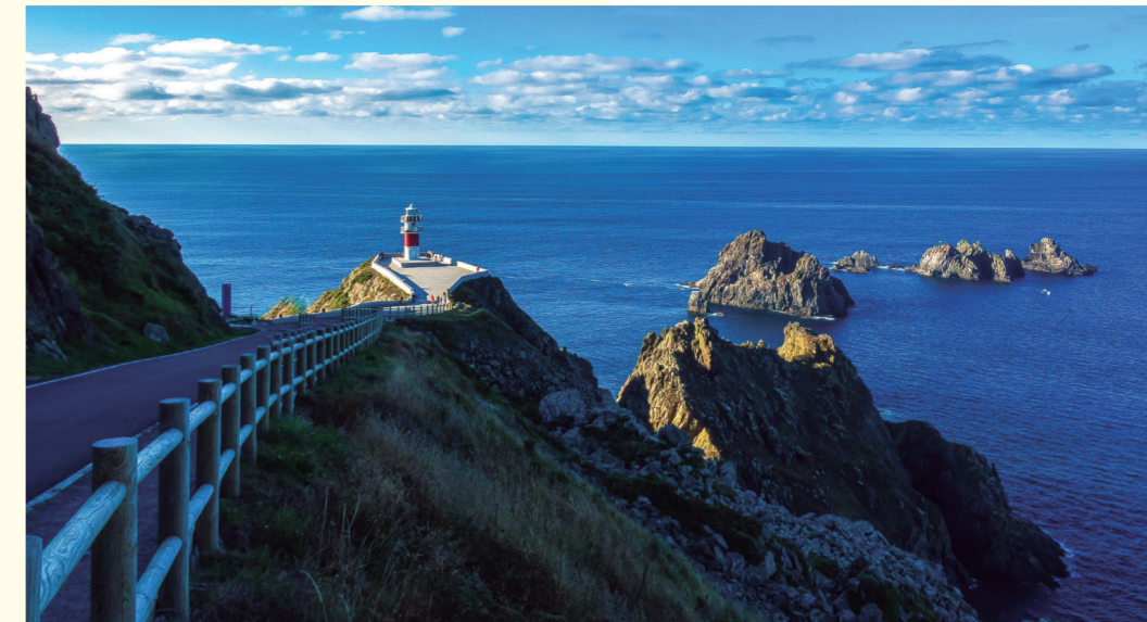
Ortel Cape Lighthouse/ Phare du Cap Ortelal