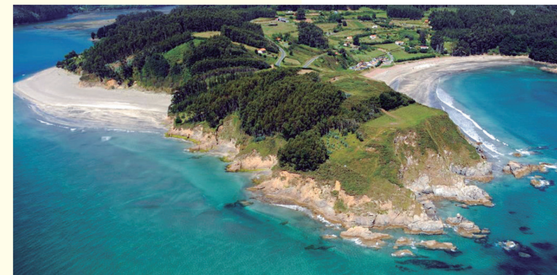
O Frade Point/Point de O Frade

Several places called Geological Interest Places are located here, for example O Limo Viewpoint, Herbeira Cliffs, Os Agullós rocks, Fornos Beach, A Miranda Mountain and Cariño-Ortigueira Inlet.