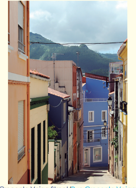
Crecente Veiga Street/Rue Crecente Veiga