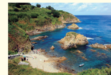
Peiral do Campo beach/Plage de Peiral do Campo