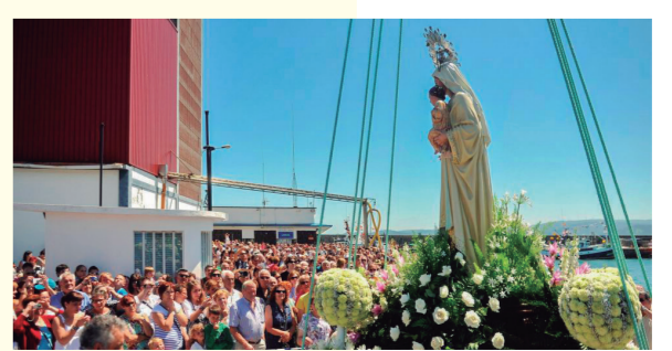
O Carme celebration/Fêtes d'O Carme

Other important celebrations in the municipality are O Entroido (Carnival) (at the beginning of the year), the Gastronomic Festival of Caldeirada and Lañada Sardine (1st saturday of August) or the Mostra de Teatro Galego de Cariño (theatre exposition in galician language) (at the end of August), among others.