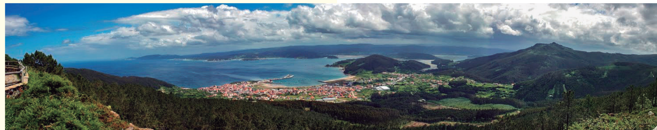
O Limo Viewpoint/Belvédère de O Limo