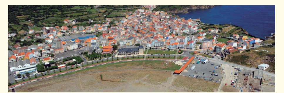
Fishermen's quarter/Quartier des pêcheurs