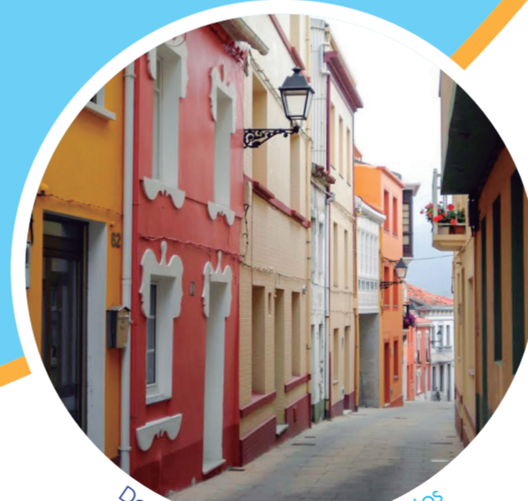
Dos Santos Street/Rue Dos Santos