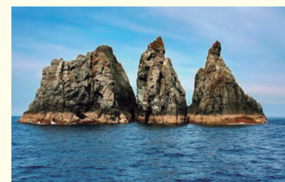
Os Agullós rocks/Roches Os Agullós