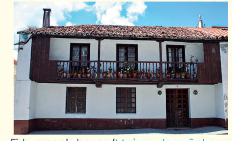
Fishermen's house/Maison des pêcheurs