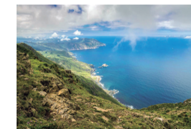
Herbeira Cliffs/Falaises d'Herbeira