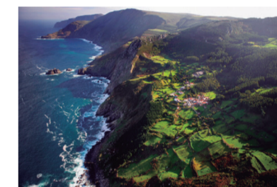
St. André de Teixido